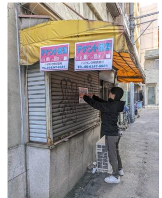
(狭い路地にある物件は、大通りからも見える様に！)