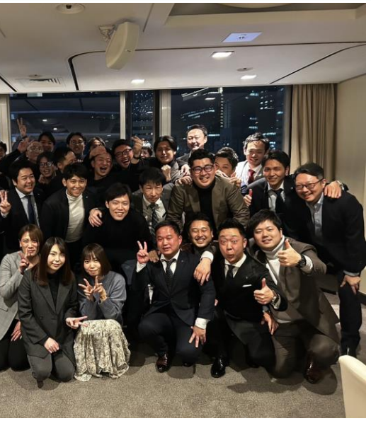
2023年忘年会にて 東京・神戸支社の社員も全員集合！

旧年中は大変お世話になりました。おかげさまで昨年は社員も11人増え、加速し続けた一年でした。新たな年にあたり、新メンバーも一団となり、一層の努力を重ね、皆様のニーズにお応えできるよう精進致します！今年も変わらぬご愛顧を賜りますようお願い申し上げます。新しい年が、皆様にとって実り多い一年となることを心から願っております。